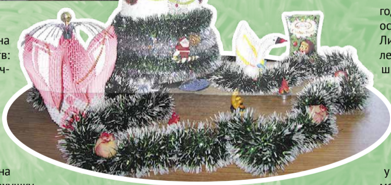
«Ёлочка в сапожках» Е. Гончаровой.

С размахом выполнена «Ёлка-петух» — коллективная работа сотрудников отдела главного технолога . Оригинальность идеи основывалась на символе