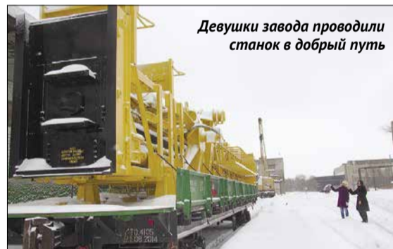
Девушки завода проводили станок в добрый путь

15 февраля погружен на четыре платформы и отправлен заказчику буровой станок СБШ-250 МНА-32. Станок стандартной комплектации, но выполнен по утверждённому ТЗ заказчика и поэтому уникален по своей комплектации и оптимально подобран под конкретные горно-геологические условия заказчика.