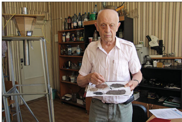
Результат разделения слабомагнитных флокул, полученных на не имеющем аналогов сепараторе