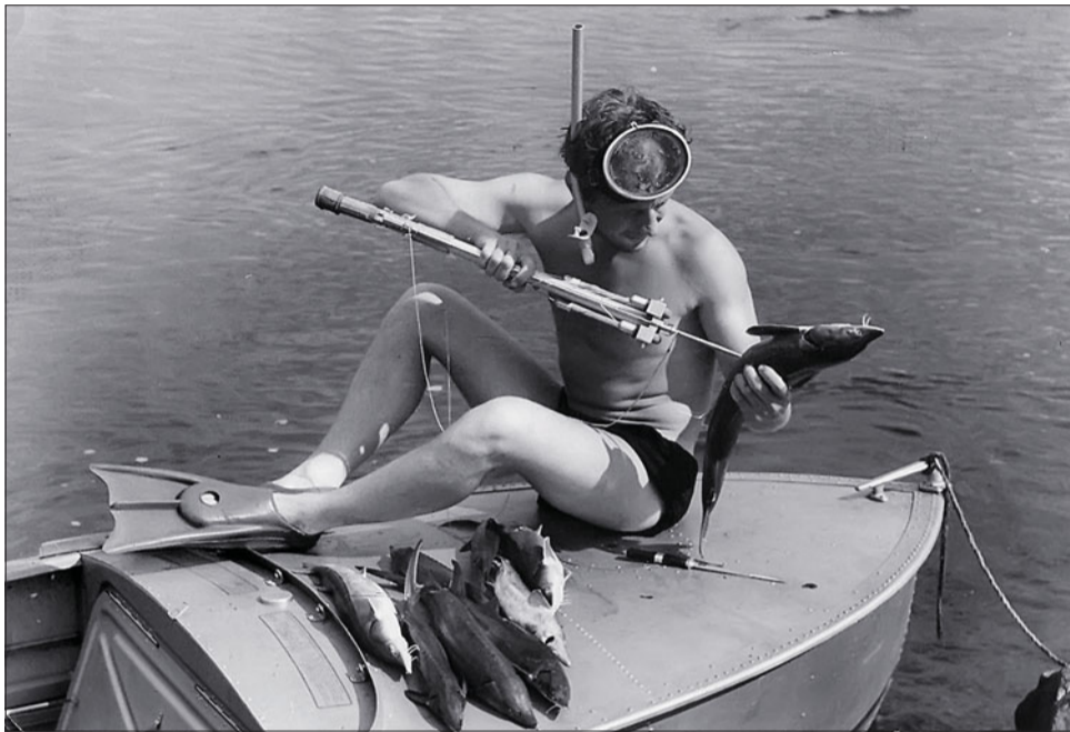
Стерлядь для ухи, добытая в водах Ангары