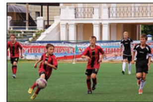
Участие юных рудгормашевцев в первенстве Воронежа по футболу, 2014 год

было пять отдельных видов секций: дартс, перетягивание каната, пенальти, мини-баскетбол и мини-футбол. Турнир также сменил и название — вместо «Здорового духа» теперь он именуется «Здоровое пятиборье». В этом состязании не так ва-