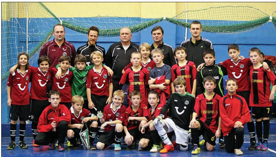
Рудгормашевская детская футбольная команда вместе с немецкой командой из Ганновера на XIII Международном футбольном турнире памяти Андрея Ликонцева

В итоге рудгормашевцы заняли третье место.