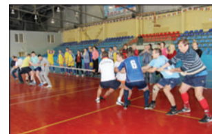
В этом году в турнире «Здоровый дух» соревновались даже в перетягивании каната

жен результат, как общение рудгормашевцев с представителями СМИ.