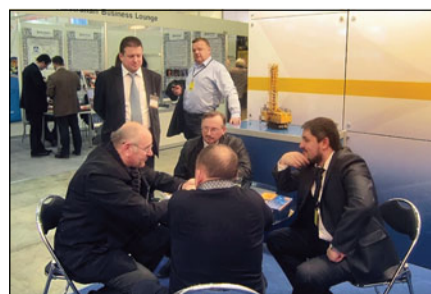
Стенд «Рудгормаша» на выставке в Москве. Переговоры с нашими потенциальными потребителями

За время проведения выставки стенд нашей компании посетили более 50 представителей технических и коммерческих структур потенциальных и действующих потребителей, поставщиков, проектных институтов, специализированных