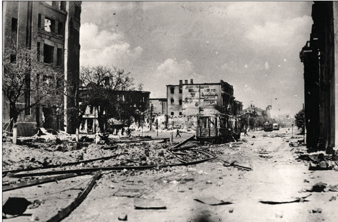
Проспект Революции в Воронеже после захвата города немецкими войсками. Июль 1942 г.

В 14 лет я, можно сказать, нахально поступил в художественную школу. А дело было так. Мы с другом пошли во Дворец пионеров, хотели посмотреть кино. Во дворце находилось много разных кружков. И я ещё издала увидел табличку «Изостудия», как заводской, шёл туда. Дёрнул дверь, она открылась, весь класс был заполнен учениками, они как раз рисовали утку. Я говорю преподавателю: «Примите меня в кружок, я очень люблю рисовать!». А учитель сказала, что набор закончен и она может меня взять только на следующий год. Я чуть не заплакал. Но сопротивляться не стал. Мы пошли с другом в кинозал, сели в кресла, приготовились к просмотру, а у меня на душе кошки скребут... Я сидел, сидел, потом поднялся и побежал обратно в художественный класс. Забегаю и говорю: «Давайте я вам сейчас нарисую эту утку!» Учитель помолчала и говорит: «Ну проходи!» Я очень быстро нарисовал птицу, сдал работу, преподаватель посмотрела и сказала: «Молодец! Беру я тебя!». Моему счастью не было предела! После я 3 года подряд занимал первые места на выставках. Когда началась война