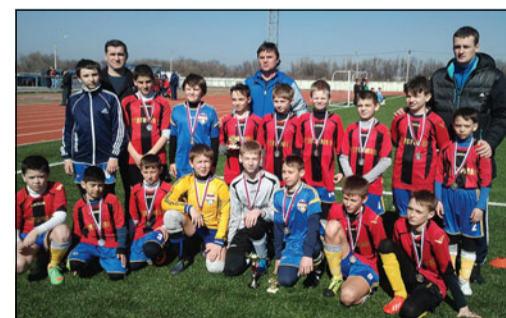
Наша детская команда на турнире «Весенние надежды». г. Рамонь, 2014 г.

На этом победы не заканчиваются – с 22 по 23 марта наши юные футболисты участвовали в турнире на призы компании «Рудгормаш» «Весенние надежды», который проходил в городе Рамони, и заняли 2-е место. А ещё раньше – с 28 февраля по 1 марта – проводился футбольный турнир, посвящённый памяти тренера К.Е. Шохина, в г. Моршанске Тамбовской области, где наши ребята стали бронзовыми призёрами.