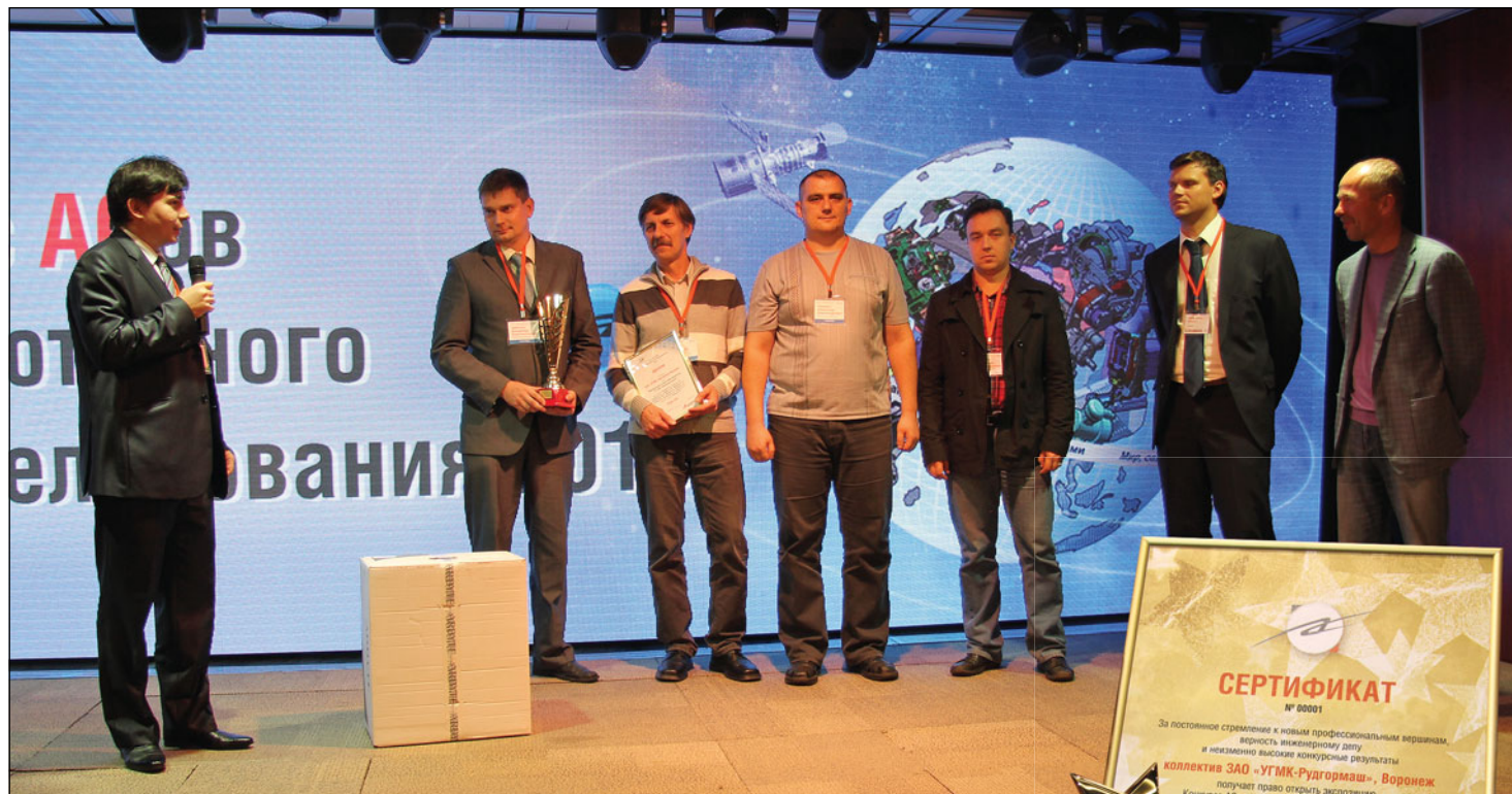
19.09.13. г. Москва. Вручение Гран-при рудгормашевской команде за победу в конкурсе АСов КОМПьютерного 3D-моделирования