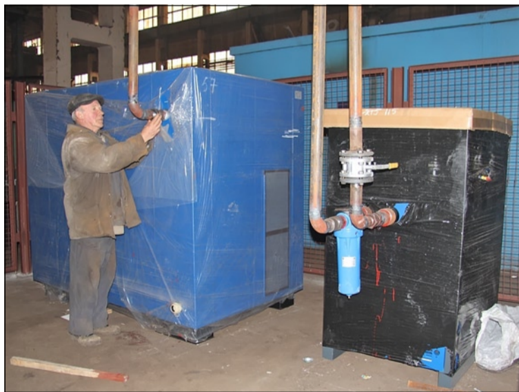
Установка автономного компрессора для производства сжатого воздуха в 4-м цехе