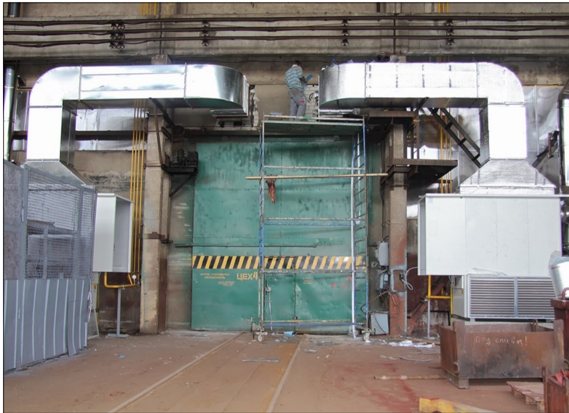
Так выглядит газозоудное оборудование тепловой завесы на въездных воротах малярного отделения 4-го цеха

— Силами 17-го цеха были подготовлены все внутрипли-