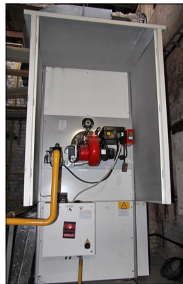
Новая система газового отопления малярного отделения цеха № 4

щадочные сети предприятия, теплотрассы, водоводы, канализации. Например, только в 17-м паросиловом цехе поменяли 270 погонных метров водопровода. Вообще, хочу сказать, что каждый цех в подготовку к зиме внёс свой вклад.