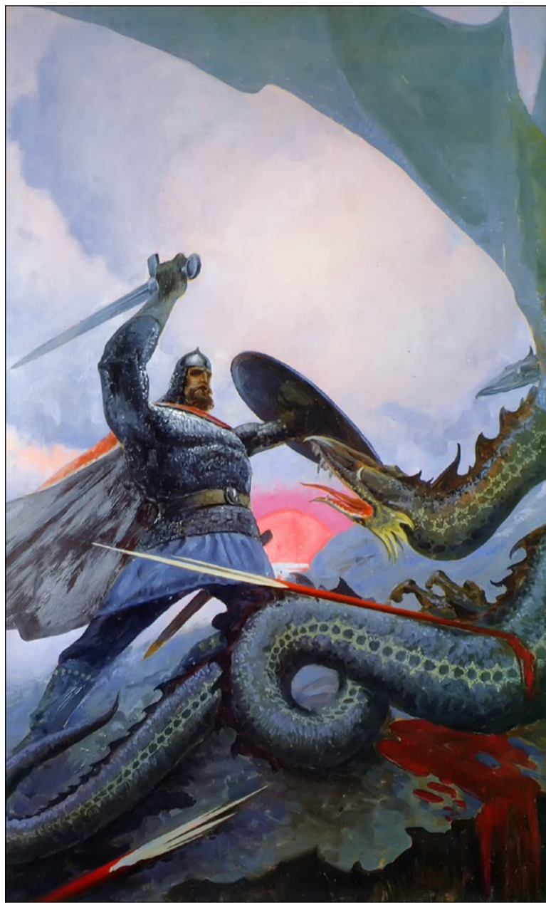
Константин Васильев. Бой Добрыни со змеем на Калиновом мосту, 1974 г.

Ещё один факт, подмеченный и аналитиками, и многими журналистами: воронежские рейдерские схемы при всём их многообразии имеют один общий элемент – молчаливое согласие, а иногда