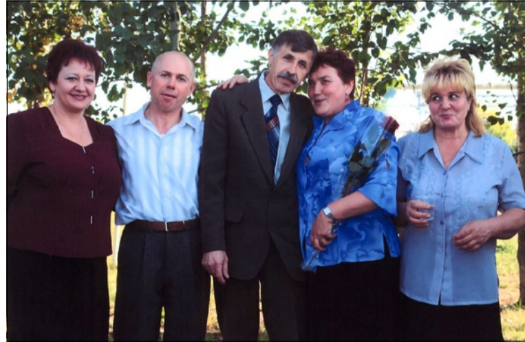
На праздновании Дня машиностроителя на стадионе, 2006 год

В припадке отчаяния однажды вечером сели мы с моим заместителем изобретать злополучный отчёт. Я ему говорю: «Вот мы с тобой два инженера... Представь, мы приехали в другую страну и попали вот в такое положение, как наш господин Рей, что бы мы сделали?». Стали мы рассуждать, что в нашем буровом станке есть отдельно механика, гидравлика, электроника... И начали постепенно рисовать таблички,