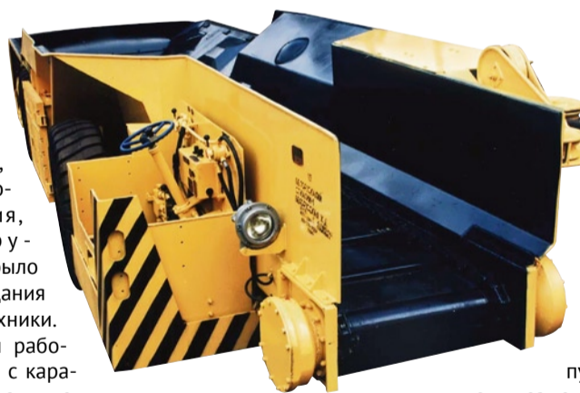
Шахтный самоходный вагон 5BC-15M

сять вагонов — сделали для предприятия «Эстонсланец». Приехали мы туда со своей продукцией. Одна бригада наотрез отказывается на воронежском оборудовании работать, ведь до этого они на американской технике вели добычу. Главный инженер мне сообщает: «Ничего не знаю, люди не хотят на ваших вагонах трудиться». Что делать? Я тогда говорю: «Давайте мне эту бригаду, они сами увидят, что на воронежских вагонах можно план выполнять». Мы с нашими наладчиками с этой бригадой ударно поработали,