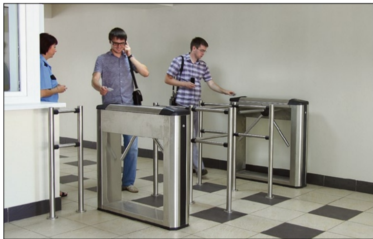
«Я не хочу судьбу иную, мне ни на что не променять ту заводскую проходную, что в люди вывела меня...»

Пройти на завод человек может строго в течение 1 часа до начала рабочего дня, а выйти — в течение 3 часов после окончания рабочего времени (в соответствии с тем графиком, по которому чело-