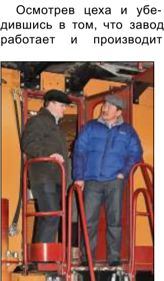
Монгольские технари внимательно осмотрели СБШ-250МНА-32, собираемый в 4-м цехе, и снаружи, и изнутри

Надо сказать, что эта монгольская компания — наш давний заказчик. «Эрдэнэт» регулярно покупают у «Рудгормаша» технику и запасные части. В этот раз целью визита иностранных гостей стало ознакомление с состоянием нашего производства, изучение новых разработок буровой и обогатительной техники и согласование технических характеристик бурового станка СБШ-250МНА-32, который они собираются приобрести в этом году.