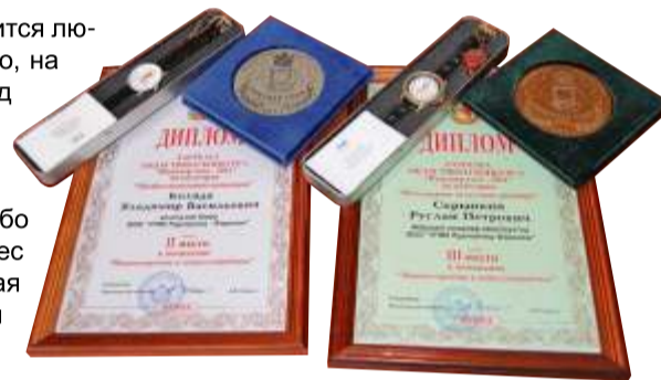
Награды, которые вручили нашим победителям конкурса «Инженер года-2011»

— Этот конкурс способствует выявлению наиболее талантливых, целеустремлённых и трудолюбивых специалистов. Они являются гордостью воронежской промышленности.