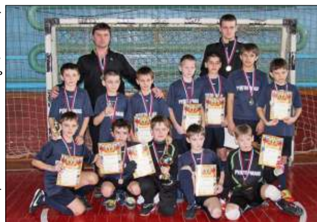
Детский футбольный клуб «Рудгормаш» занял первое место в турнире «Весенние надежды»

1-е место заняли воспитанники футбольного клуба