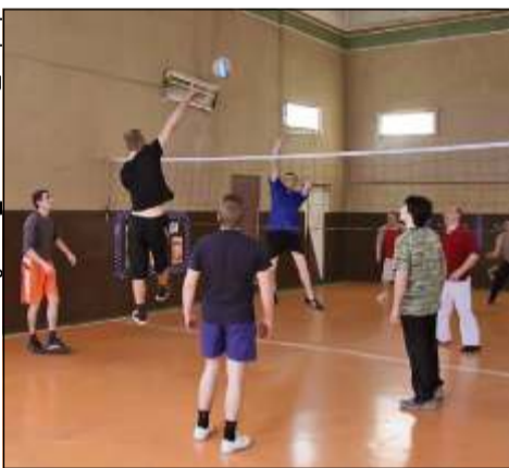
Матч между сборной 7-го цеха и командой службы безопасности

— Здорово, что есть такие соревнования. Я только пришёл на завод, и службы безопасности