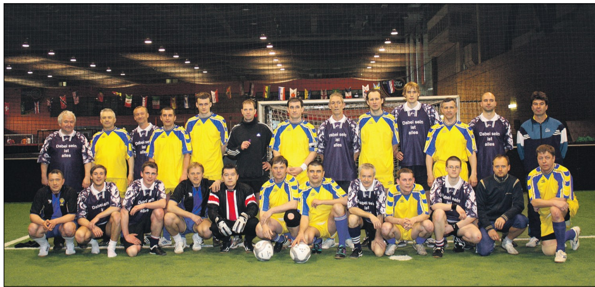
Футболисты ветеранской сборной «Рудгормаша» в сине-жёлтой форме, немцы – в сине-белой