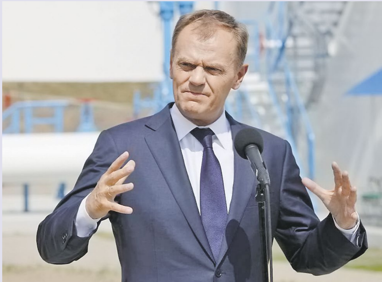
■ Дональд Туск

Премьер-министр Польши Дональд Туск, в пятницу вечером обсудил с главой МВД и министром юстиции ситуацию в Варшаве в связи с указанными беспорядками, отреагировал введением в Польшу карательных мер по отношению к полякам.