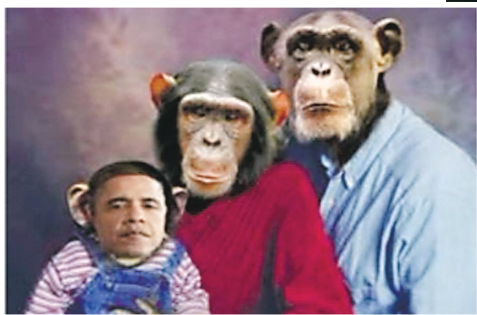
■ Карикатура из американских СМИ

Она смотрела вниз, когда говорила о том, как президент России Дмитрий Медведев возглавит конференцию в рамках ротации должности председателя. Но когда прочла, что пост ранее занимал Обама, она якобы отчетливо подняла руку, а затем средний палец. Американская недремлющая общественность воспользовалась сложившейся ситуацией – признала, что неправильно сложившиеся в кулак пальцы ведущей на самом деле являются оскорбительным жестом в адрес Барака Обамы. Мол, ему показали «Фак!» Для пущей убедительности американцы улови-